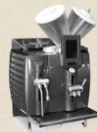
2003 Coffee Celebration