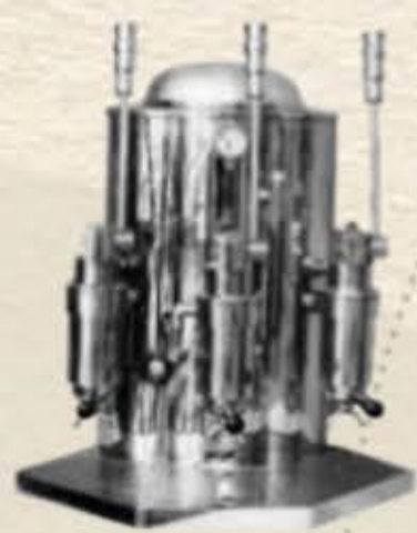
1924 Coffee preparation apparatus