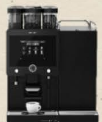
2017 Coffee Soul