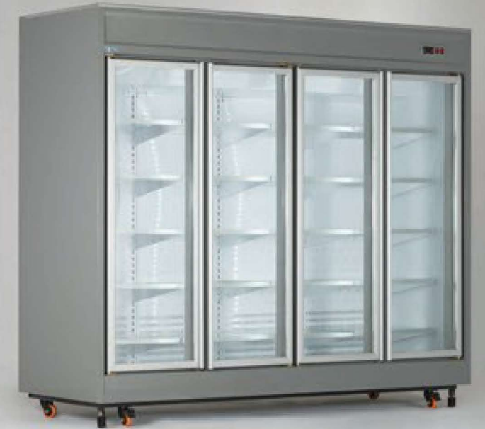
یخچال فروشگاهی ویترینی سری RV