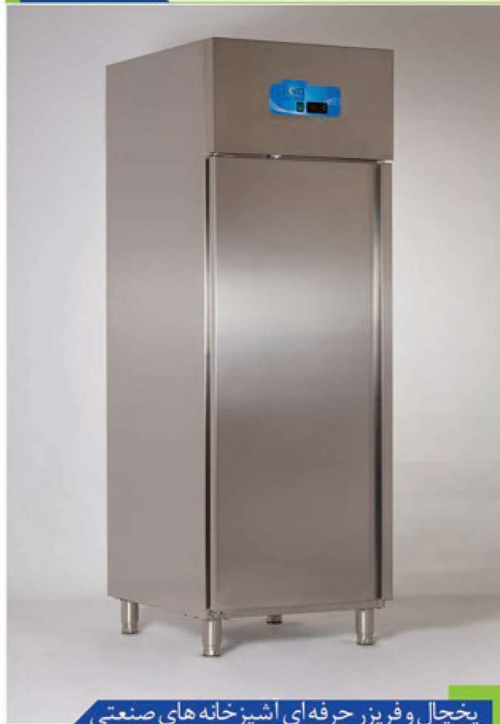
یخچال و فریزر حرفه ای آشپزخانه های صنعتی

درون کابین که باعث ایجاد دمای یکنواخت در کل کابین و حفظ تازگی مواد غذایی می شود بخشی از قابلیت های این محصول است. کلیه قطعات به نحوی برش داده شده اند که احتمال هرگونه بریدگی و آسیب در اثر گوشه های تیز از بین رفته و لبه هایی هموار ایجاد شده است. این محصولات به منظور انجام فعالیت های حرفه ای طراحی گردیده است.