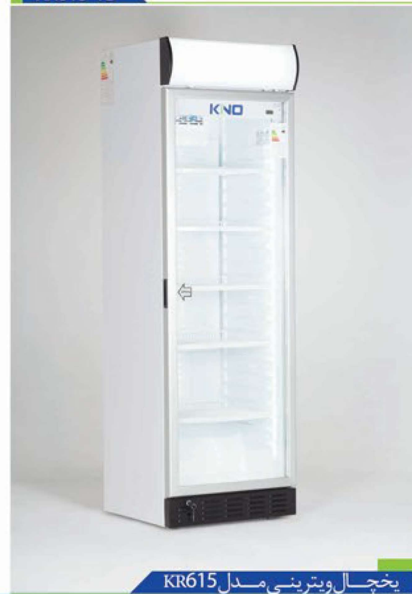
یخچال ویترینی مدل KR615

استفاده از شیشه های سکوریت و دوجداره استاندارد حاوی گاز عایق آرگون بوده که موجب گردیده اتلاف حرارت به حداقل برسد، سکوریت بودن شیشه نیز موجب گردیده در صورت شکستگی شیشه، خطرات ناشی از خرد شدن شیشه نیز به حداقل برسد. محصولات خانواده کینو تماما دارای عایق بندی فوم پلی اورتان بوده که توسط دستگاههای اتوماتیک تزریق می شوند. محصولات قابلیت چاپ برچسب با طرح دلخواه را نیز دارا می باشند.