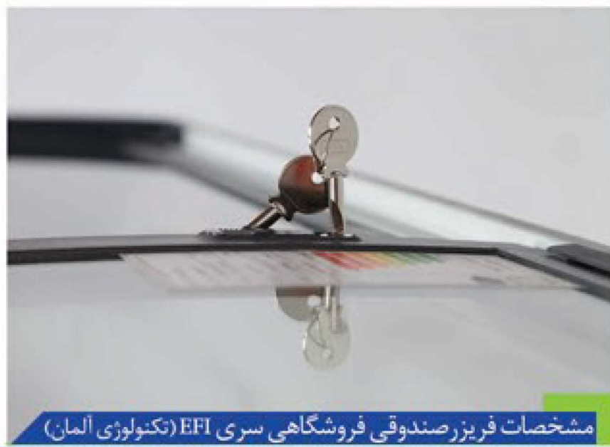
مشخصات فریزر صندوقی فروشگاه سری EFI (تکنولوژی آلمان)