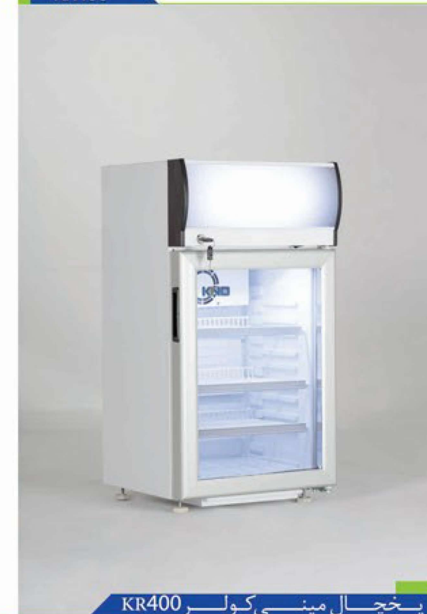
یخچال مینی کولر KR400

یخچال عرض ۴۰ خانواده کینو دارای گنجایش مفید ۳۰ لیتر بوده که جهت نمایش هرچه بهتر انواع مواد غذایی خاص نظیر انواع شکلات ها، خاویار، نوشیدنی ها و ... با ابعاد کوچک طراحی گردیده است. سیستم توزیع هوای یکنواخت موجود در این محصول سبب شده تمام نقاط کابین دارای درجه حرارت یکسان بوده که این خود نیز به جهت نگهداری و اطمینان از سلامت مواد غذایی بسیار حائز اهمیت می باشد.