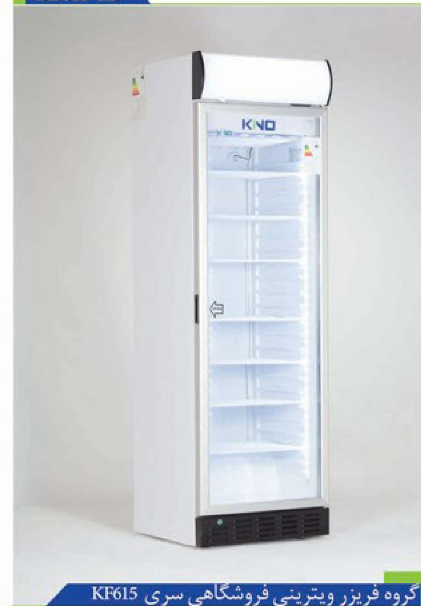
گروه فریزر ویترینی فروشگاهی سری KF615

فریزر عرض ۶۰ خانواده کینو دارای گنجایش مفید و بهینه ۳۰۰ لیتر بوده و این گنجایش جهت مصارف تجاری بسیار حائز اهمیت است. از جمله نقاط قوت محصول، بکارگیری از تکنولوژی روز دنیا جهت طراحی سیکل تبرید و دریافت رده انرژی A می باشد. از مزایای قابل ملاحظه محصول سیستم توزیع هوای یکنواخت موجود در این محصول می باشد که سبب شده تمام نقاط کابین دارای درجه حرارت یکسان بوده و این خود نیز به جهت نگهداری و اطمینان از سلامت مواد غذایی بسیار حائز اهمیت می باشد.