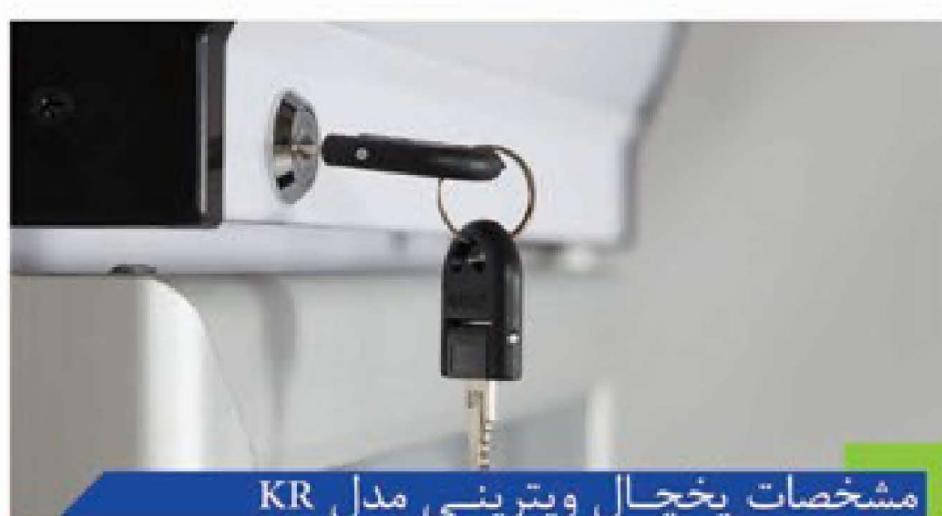
مشخصات یخچال ویترینی مدل KR