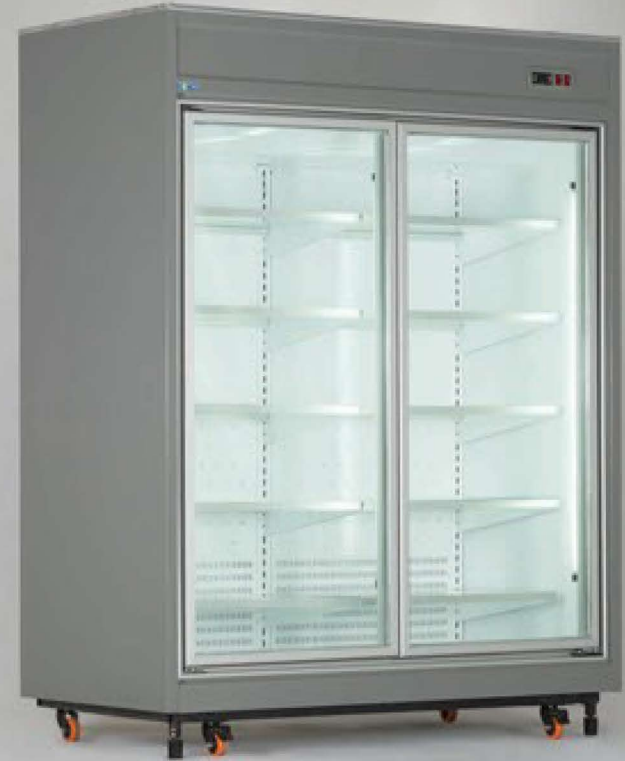
یخچال فروشگاهی ویترینی سری RV