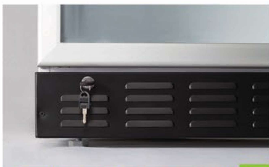
مشخصات فریزر ویتروینی فروشگاهی سری KF