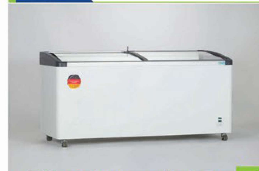
فریزر صندوقی فروشگاه سری EFI (تکنولوژی آلمان)

سکوریت بودن شیشه نیز موجب گردیده در صورت شکستگی شیشه، خطرات ناشی از خرد شدن شیشه به حداقل رسد. از جمله وجوه متمایز محصولات سری EFI نسبت به سری CF می توان به وجود سیستم روشنایی، بهره گیری از تکنولوژی روز دنیا و همچنین استفاده از ورق داخلی خود رنگ اشاره کرد. کلیه مدل ها قابلیت شست و شوی داخل کابین را دارا می باشند که آب حاصل از آن توسط راهگاه تعبیه شده در کف محصول به خارج هدایت می گردد.