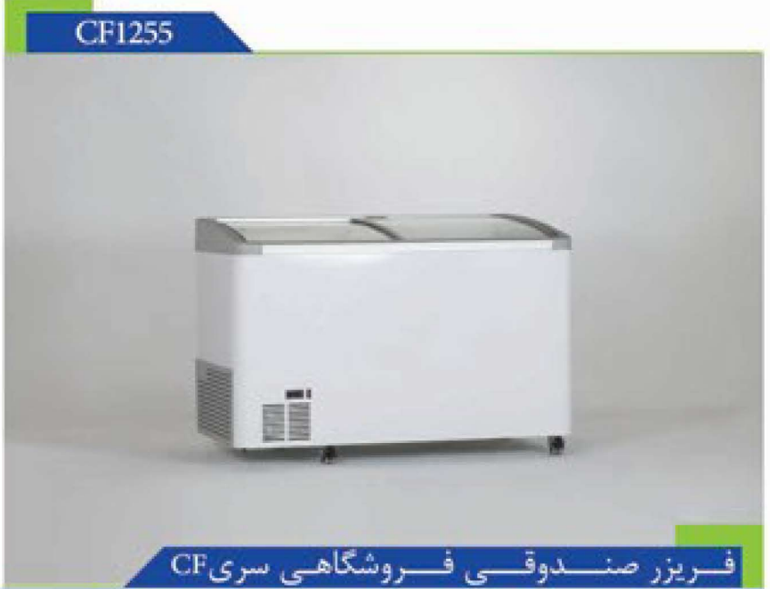
مشخصات فریزر صندوقی فروشگاه‌های سری CF