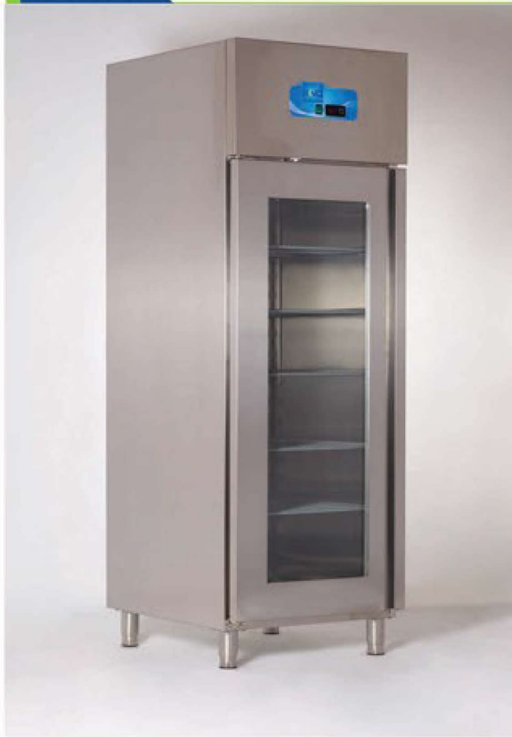
RS G1/FS G1