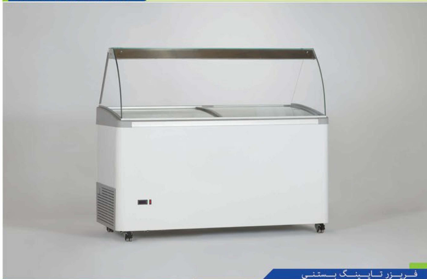
فریزر تاپ‌ینگ بستنی

از جمله نکات برجسته محصول استفاده از شیشه Low E استاندارد بوده که موجب گردیده اتلاف حرارت به حداقل برسد، سکوریت بودن شیشه نیز موجب گردیده در صورت شکستگی شیشه، خطرات ناشی از خرد شدن شیشه به حداقل رسد. محصولات تاپ‌ینگ تماماً دارای عایق بندی فوم پلی اورتان بوده که توسط دستگاههای اتوماتیک تزریق می شوند. کلیه فریزرهای تاپ‌ینگ قابلیت شست و شوی داخل کابین را دارا می باشند که آب حاصل از آن توسط راهگاه تعبیه شده در کف محصول به خارج هدایت می گردد.