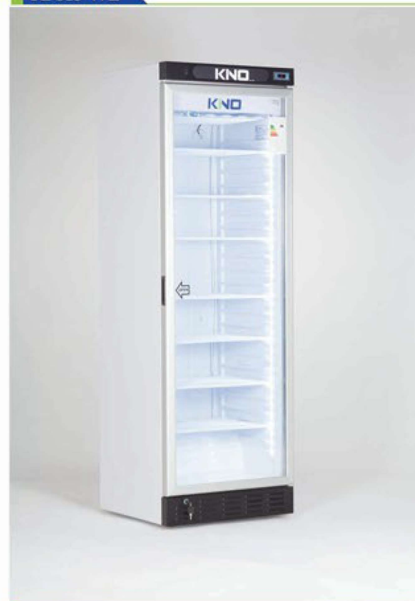
گروه فریزر ویتروینی فروشگاهی سری KF615 WL

فریزر عرض ۶۰ سری WL خانواده کینو با حفظ کلیه مشخصات فنی با ظرفیت مفید ۳۰۰ لیتر، رده انرژی A و سیستم توزیع هوای یکنواخت با حذف نمایشگر تبلیغاتی و کاهش ارتفاع برای مصرف کنندگانی که محدودیت ارتفاع داشته یا کاربردی غیر تبلیغاتی دارند مانند بیمارستانها، آزمایشگاهها، داروخانه ها و ... طراحی شده است.