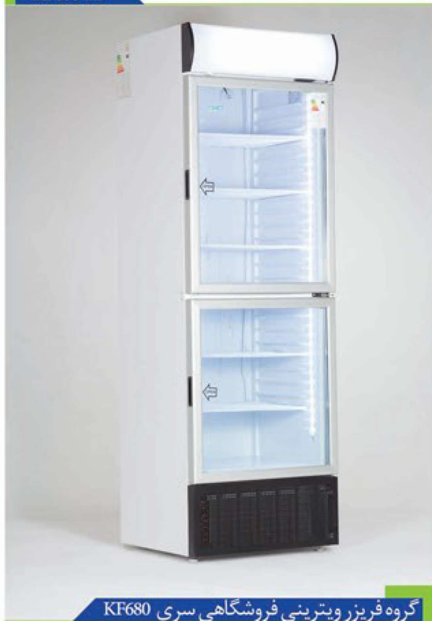
گروه فریزر ویترینی فروشگاهی سری KF680

فریزر عریض ۶۸ خانواده کینو با گنجایش ۳۶۰ لیتری بهینه، سهم بزرگی از بازار را به خود اختصاص داده است. سیستم توزیع هوای یکنواخت موجود در محصول و توان بالای سرمادهی این محصول از نقاط قوت این محصول می باشد. استفاده از شیشه های سکوریت و سه جداره استاندارد حاوی گاز عایق آرگون در محصول نیز موجب گردیده اتلاف حرارت به حداقل برسد. استفاده از حداکثر فضای داخلی کابین از جمله محاسن محصول بوده