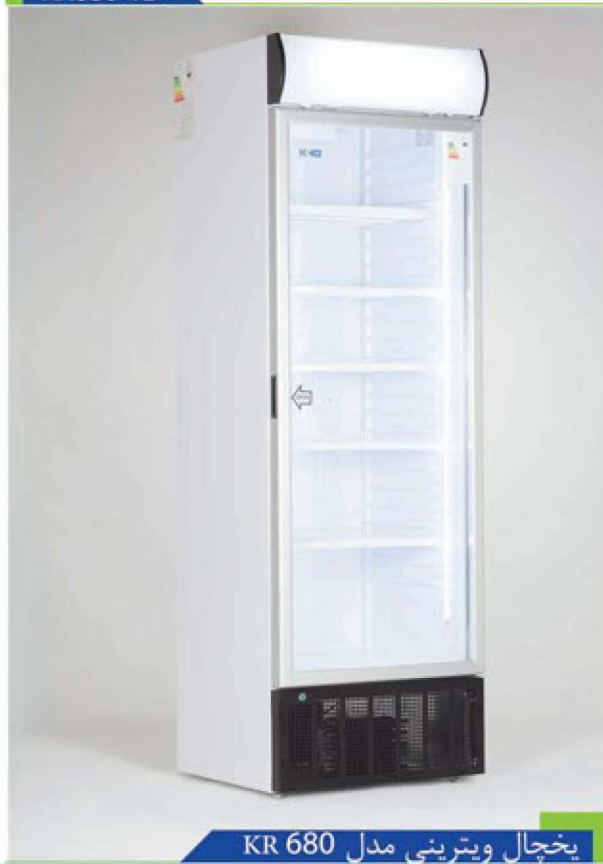
یخچال ویترینی مدل KR 680

استفاده از شیشه های سکوریت و دوجداره استاندارد حاوی گاز عایق آرگون در محصول نیز موجب گردیده اتلاف حرارت به حداقل برسد.